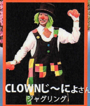
CLOWNじ〜によさん ジャグリング